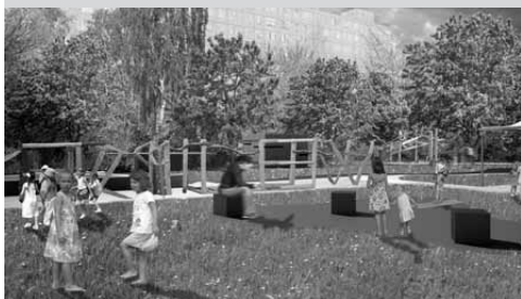
vizualizace návrhu Atelieru zahradní a krajinářské architektury, Brno