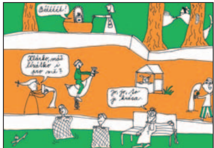
květen 2009 - Dvořáčkův a Janurův park po proměně