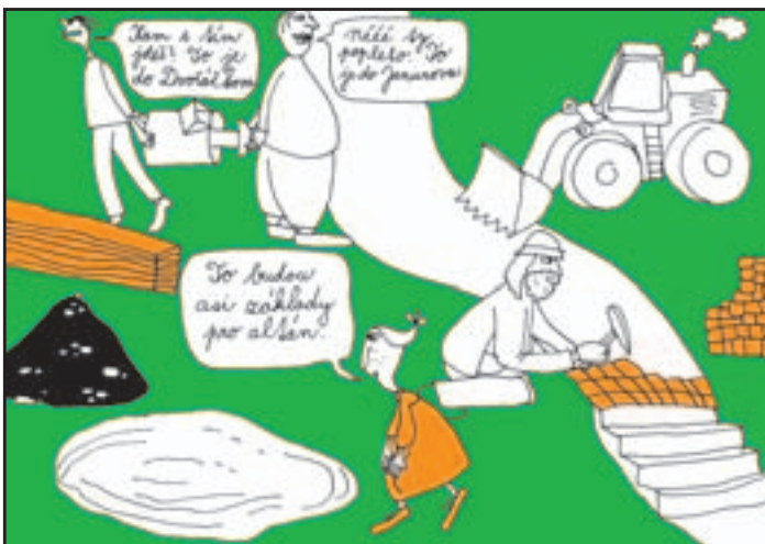
červen 2008 - Stavební práce v parcích