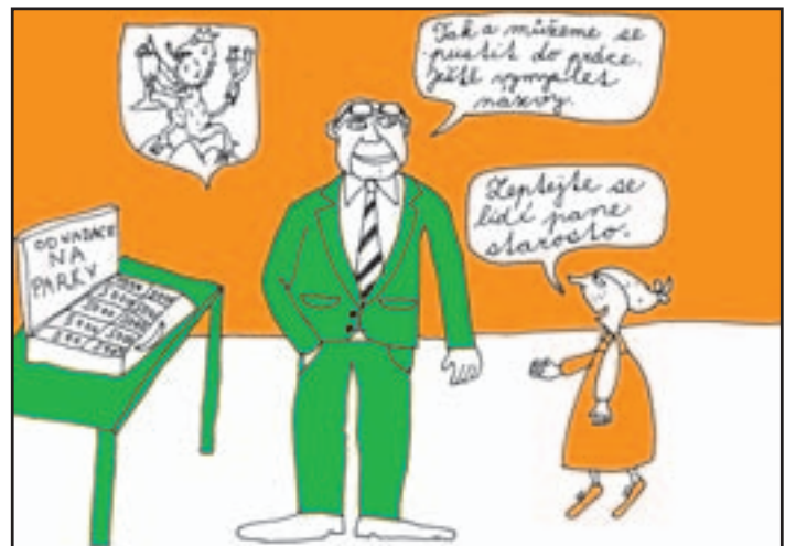
duben 2006 - Zahájení projektu: nadace PROMĚNY věnuje na parky téměř 20 milionů Kč.