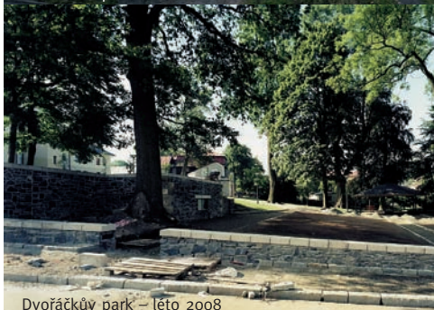
Dvořáčkův park – léto 2008