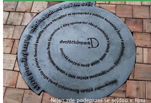
Nějen zde podepsaní se sejdou v říjnu

V polovině října navštíví oba parky dárce finančních prostředků na jejich obnovu. Na této uzavřené akci se sejde celý realizační tým projektu u příležitosti blížícího se ukončení stavby. Potkají se zde představitelé šenovské radnice, zástupci nadace v čele se svými zakladateli a dále ti, kteří na projektu úzce spolupracovali: architekti z atelieru AND, hlavní dodavatel stavby, společnost Gardeline, i ostatní tvůrci.