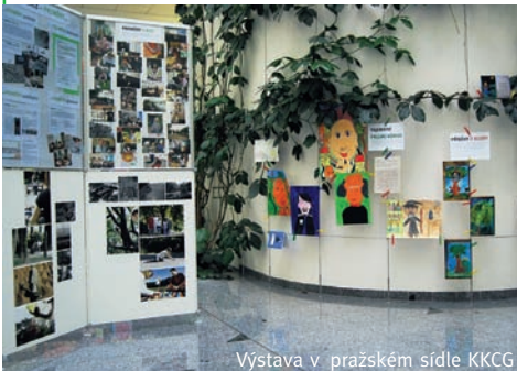
Výstava v pražském sídle KKCG

V srpnu a v září jsme nejen o šenovském projektu informovali prostřednictvím výstavy v pražském sídle finanční a investiční skupiny KKCG, která finančně podporuje nadační projekty. Zaměstnanci společnosti KKCG i procházející návštěvy se tak měli možnost dozvědět více i o Šenovských parcích, prohlédnout si fotografie z jejich výstavby a všech doprovodných akcí.