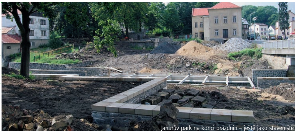
Janurův park na konci prázdnin – ještě jako staveniště

Dvořáčkův park je koncipován jako místo setkávání generací. Svým návštěvníkům nabídne hned několik možností k využití: dětské hřiště, plochu pro pétanque, altán i klidná zákoutí k posezení nad knihou nebo s přáteli. Dvojnásobně velký Janurův park leží na březích Šenovského potoka v blízkosti místní základní školy, a bude proto využíván zejména mladší generací. Herní prvky, které zde vzniknou, učiní z parku místo aktivního odpočinku a zábavy. Výraznou změnou v prostoru bude nové, široké přemostění potoka. V parku navíc zůstanou zachovány fragmenty bývalých budov jako připomínka minulosti místa.