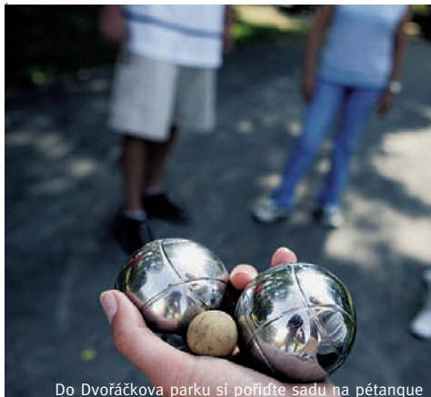
Do Dvořáčkova parku si pořídíte sadu na pétanque

V parku, který „lící“ zejména na mladší návštěvníky, čekají vodní hrátky, nové hřiště s moderními herními prvky nebo pozůstatky tajemného domu, kde bude možné vyčíst z kamenného hlavolamu jedno z dávných tajemství. Potok, jenž parkem protéká po dně hlubokého kamenného koryta, se zčásti skryje pod velkorysým přemostěním, připomínajícím pobřežní molo. Návštěvníci parku nebudou ochuzeni o pohled na zrekonstruovanou vodní kaskádu nad parkem, ani zvuk zurčící vody, průchod parkem se přitom zjednoduší a příjemnější. Další využití mola už závisí na vašich nápadech: galerie pod širým nebem, herní plocha, místo pro rozcvíčku před hodinou tělocviku, „plátno“ pro kresbu křídou, taneční parket... Fantazii se meze nekladou. Bezpochyby nejoriginálnější „vybavením“ každého parku jsou totiž jeho návštěvníci, kteří mu svou přítomností vdechují život. Pokud parkům věnujete svůj čas a zájem, budou žít s vámi. Jejich první sezónu společně zahájíme už příští rok na jaře.