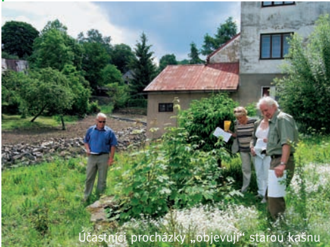
Účastníci procházky „objevují“ starou kašnu