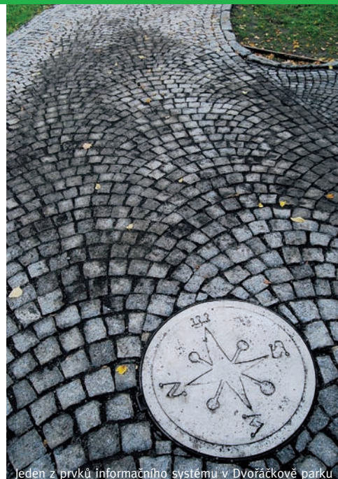
Jeden z prvků informačního systému v Dvořáčkově parku

Jednotlivé prvky v sobě nesou hravost a vtíp, vybízejí k zábavné aktivitě, motivují k pátrání po historii a připomínají názvy obou parků. Naším cílem při tom je, aby informační systém nebyl narušitelem celkového rázu: naopak, měl by s novým parkem co nejvíce splynout jako jeho přirozená součást. V každém parku proto vznikl původní soubor umělecky ztvárněných informačních prvků na míru danému prostoru a zde uplatněnému architektonickému řešení. Všechny jeho části jsou z kamene nebo kovu. Autorem designu je grafik Jiří Pros, prvky samotné vytvořili z kovu Mgr. A. Martin Janda a z kamene Michael Stránský. Informační systém finančně zajistilo město Kamenický Šenov.