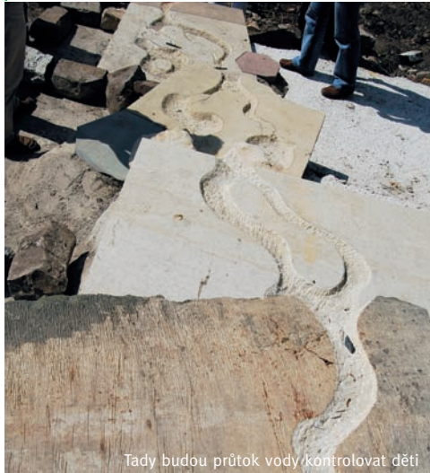
Tady budou průtok vody kontrolovat děti